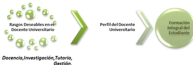
Figura No. 1 Actividades que contribuyen a la formación integral del docente universitario.

Al analizar estos marcos de referencia se identifica afinidad en los elementos que sustentan el establecimiento del perfil del docente universitario que demanda una IES, habilitado para participar en programas de licenciatura y posgrado, en beneficio de la formación de los estudiantes y con una participación activa en la consolidación de la Institución Educativa. Todas estas acciones se estratificaron en categorías que reflejan acciones sustantivas que se consideran al evaluar a un profesor de tiempo completo, en la figura No.1, se muestra el conjunto de rasgos deseables que identifiquen al profesor universitario como resultado de la participación en diversas actividades académicas que se consideran al evaluar el Perfil Deseable de un Docente Universitario, ya que en cada una de ellas se busca la contribución a la formación integral del estudiante.