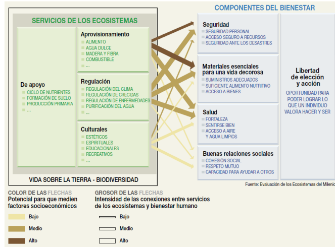
Figura 1. Relaciones entre la demanda Humana y ecosistemas

Un indicador clave para la sustentabilidad es el concepto de “huella ecológica”, el cual indica el impacto ambiental generado por la demanda humana sobre los ecosistemas.