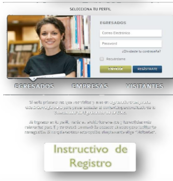
Figura 7. Portal de egreso UAC.